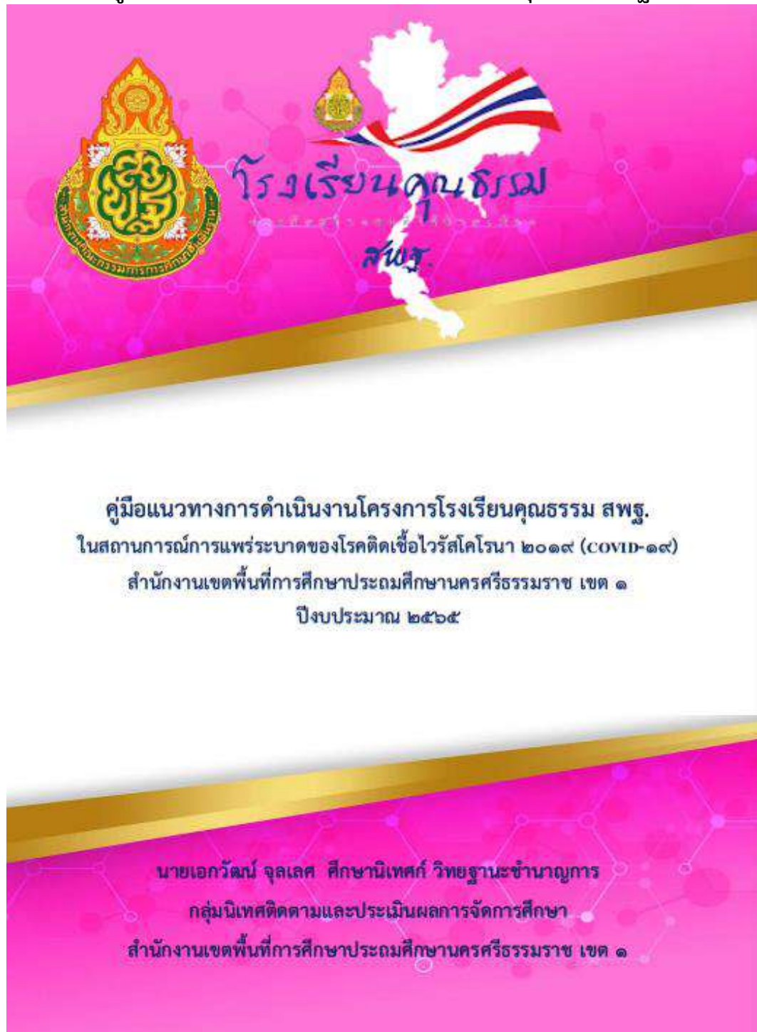
ภาพที่ 2 คู่มือแนวทางการดำเนินงานโครงการโรงเรียนคุณธรรม สพฐ.

คู่มือแนวทางการดำเนินงานโครงการโรงเรียนคุณธรรม สพฐ.