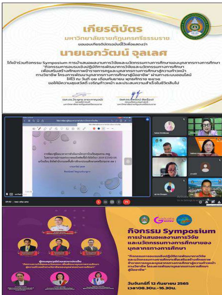
ภาพที่ 3 แสดงการเผยแพร่ผลงาน

นำเสนอผลงานการวิจัยและนวัตกรรมทางการศึกษาของบุคลากรทางการศึกษา “กิจกรรมการอบรมเชิงปฏิบัติการพัฒนาการวิจัยและนวัตกรรมทางการศึกษา เพื่อเสริมสร้างศักยภาพข้าราชการครูและบุคลากรทางการศึกษาสู่ความก้าวหน้าทางวิชาชีพ โครงการพัฒนาบุคลากรทางการศึกษาสู่มืออาชีพ” ผ่านทางระบบออนไลน์ในวันที่ 12 กันยายน 2565 จัดโดยคณะครุศาสตร์ มหาวิทยาลัยราชภัฏนครศรีธรรมราช